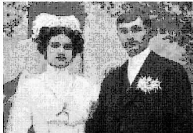
Sin M. Lukinića i snaja Hrvatica, (fotografija preuzeta iz studije

U određivanju karakternih crta pripadnika hrvatske zajednice, Sporšić navodi kako su gotovo svi predijalci bili veoma osioni, bahati, neobrazovani, neradnici i slabog morala . Iako je u Boki biskup Maksimilijan Vrhovac osnovao 1806. godine školu, hrvatska deca slabo su je pohađala. Od 1848. godine svi muški članovi porodica uzimali su aktivno učešće u političkom životu južne Ugarske. Određenu traumu prema svom socijalnom statusu doživljavaju Hrvati u srednjem Banatu nakon Prvog svetskog rata. Naime, predijalci u Boki, Neuzini i Radojevu izgubili su de jure plemićki status usled orijentacije društveno-političke orjenatcije Kraljevine SHS koja ukida plemićke titule, dok su Hrvati u Keči, koja je pripala Rumuniji, status plemića zadržali.