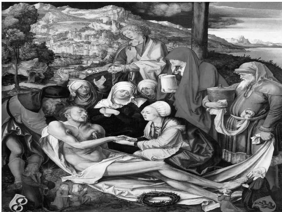
Slika 1. Albrecht Direr "Oplakivanje Hrista"; Jedan od najvećih slikara renesanse prikazujući biblijski motiv Hristovog stradanja, preko krvi koja još uvek curi iz rana, postiže izrazitu dramatiku i emotivnost.