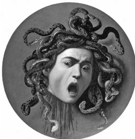
Slika 2. Karavađo "Meduzina glava"; Dislocirana glava meduze od tela, uokvirena "potocima krvi" i vencem od zmija, pronalazi put do najnegativnijih predela ljudske duše.