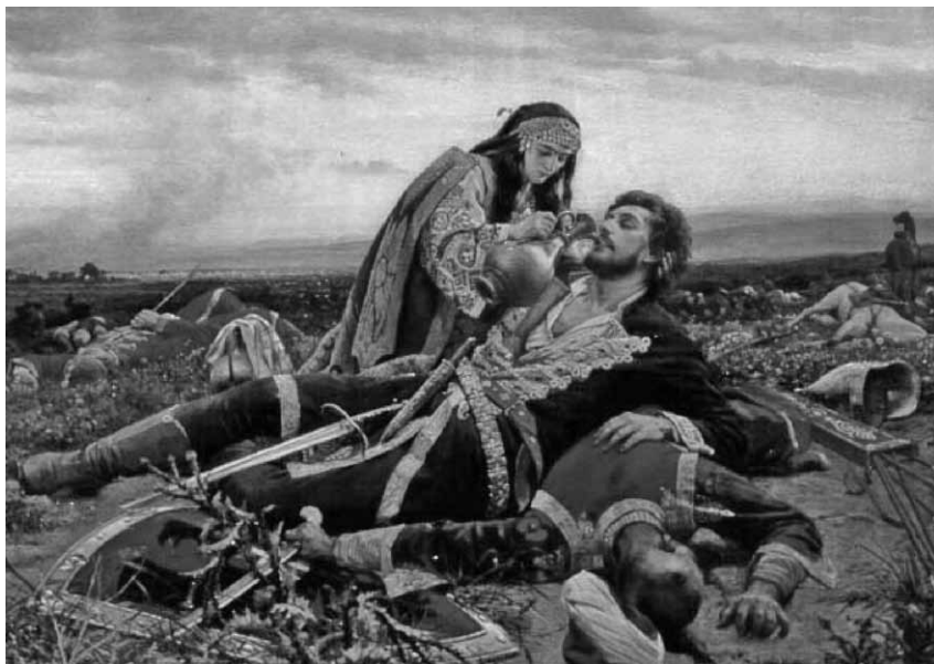
Slika 4. Uroš Predić "Kosovka devojka"; Izmaskirano telo junaka i "krv koja još kaplje", nas uveravaju da stradanje, mit i reinkarnacija Kosovskog boja nisu fikcija.