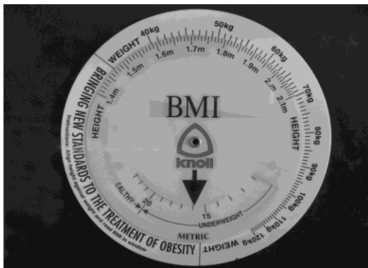
Slika 2. Pomoćni šablon za izračunavanje indeksa telesne mase i prikaz zabeležene vrednosti kod ispitanice ženskog pola sa smanjenom težinom i normalnom visinom

Figure 2. Accessory guide for calculation of BMI, exposing noted numerical values of women with underweight and decreased height