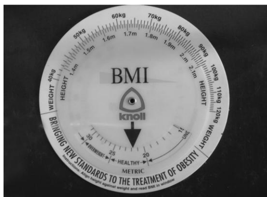
Slika1. Pomoćni šablon za izračunavanje indeksa telesne mase i prikaz zabeležene vrednosti kod osobe ženskog pola sa normalnom težinom i normalnom visinom

Kod muškaraca su prosečne vrednosti iznosile \text{BMI} = 17,1 \text{ kg}/\text{m}^2 , gustine skeleta T = -1,8 , i gustine tela kostiju mandibula \rho_0 = 0,98 \text{ U}/\text{mm}^2 (Tabela 1a 1b). Upoređivanjem vrednosti BMI, gustine skeleta i gustine tela kostiju mandibula, izračunata vrednost Pirsonovog (Pearson) koeficijenta korelacije je iznosila 0.324. Vrednost Spirmanovog (Spearman) koeficijenta korelacije je iznosila 0.219.